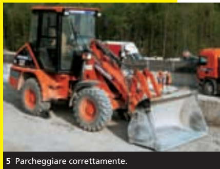
5 Parcheggiare correttamente.