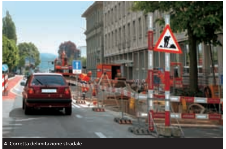
4 Corretta delimitazione stradale.