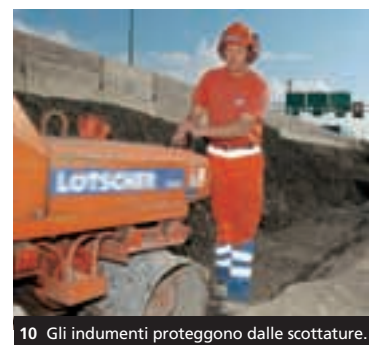
10 Gli indumenti proteggono dalle scottature.