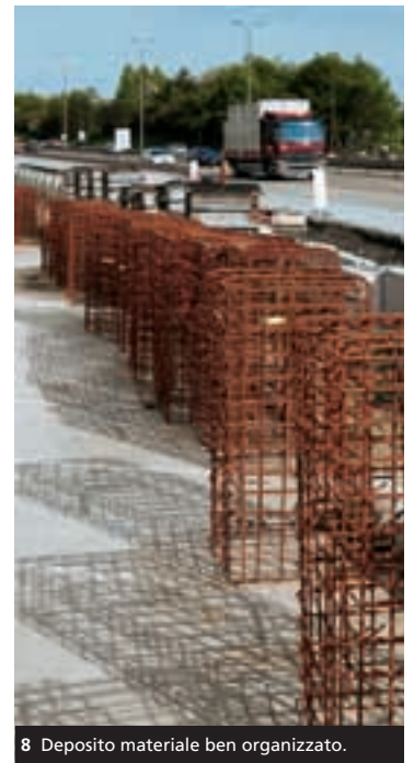
8 Deposito materiale ben organizzato.