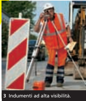
3 Indumenti ad alta visibilità.