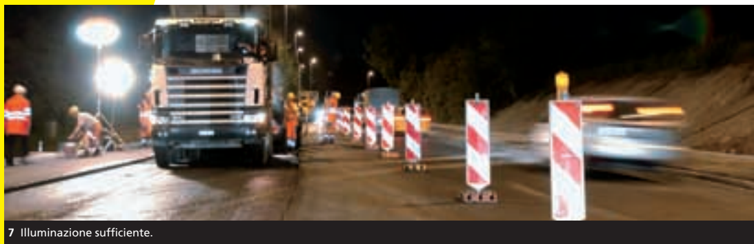
7 Illuminazione sufficiente.