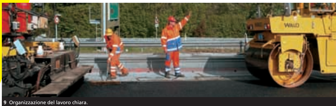
9 Organizzazione del lavoro chiara.