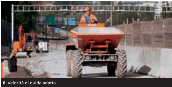
6 Velocità di guida adatta.