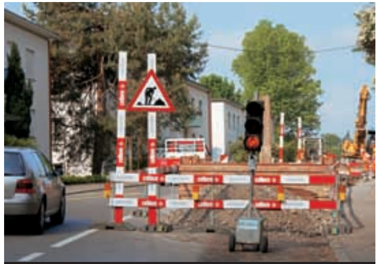
1 Materiale di scavo come zona di protezione.

SBV Schweizerischer Baumeisterverband SSE Société Suisse des Entrepreneurs SSIC Società Svizzera degli Impresari-Costruttori Societad Svizra dals Impresaris-Constructurs