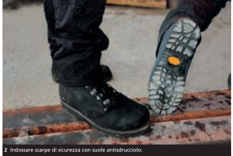
2 Indossare scarpe di sicurezza con soles antidrucciolo.