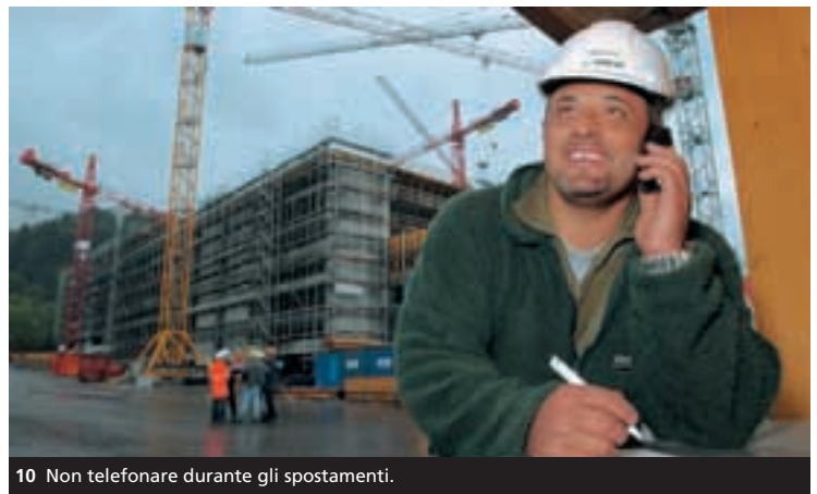
10 Non telefonare durante gli spostamenti.