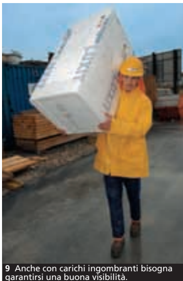
9 Anche con carichi ingombranti bisogna garantirsi una buona visibilità.