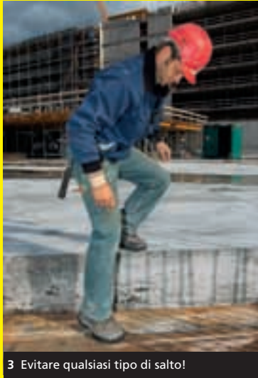
3 Evitare qualsiasi tipo di salto!