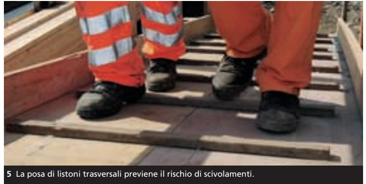
5 La posa di listoni trasversali previene il rischio di scivolamenti.