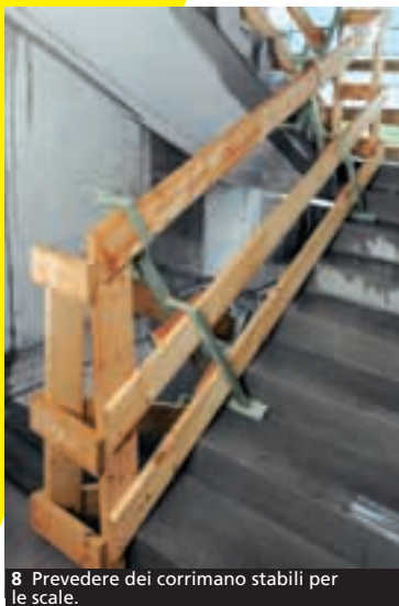
8 Prevedere dei corrimano stabili per le scale.