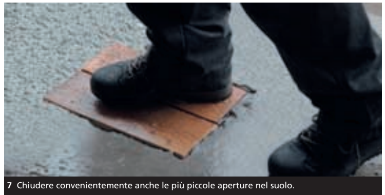
7 Chiudere convenientemente anche le più piccole aperture nel suolo.