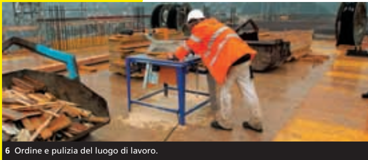
6 Ordine e pulizia del luogo di lavoro.