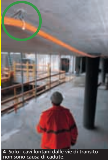
4 Solo i cavi lontani dalle vie di transito non sono causa di cadute.