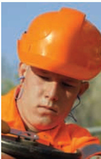
4 Piccoli ed efficaci.