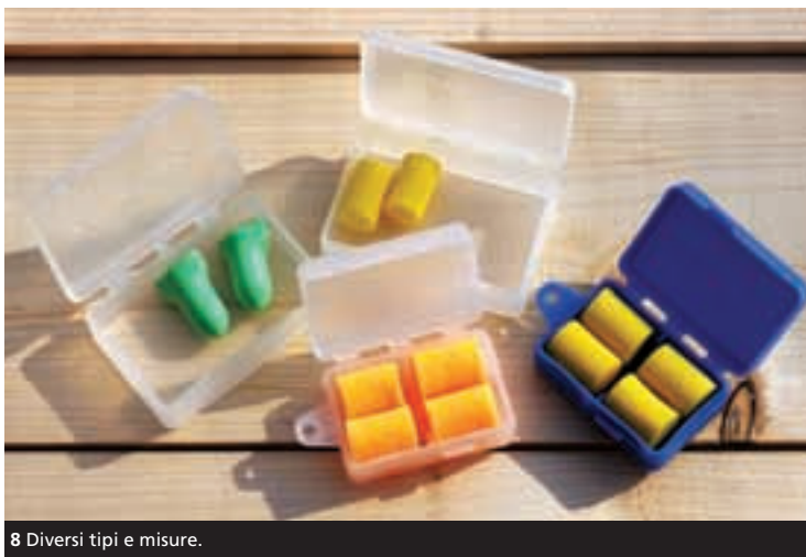
8 Diversi tipi e misure.