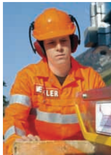
5 Cuffia antirumore abbinata al casco di protezione.