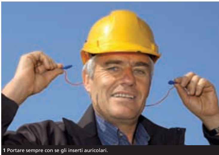
1 Portare sempre con se gli inserti auricolari.

Italiano – UCSL-Info appare anche in tedesco, francese, spagnolo, portoghese e serbo-croato.