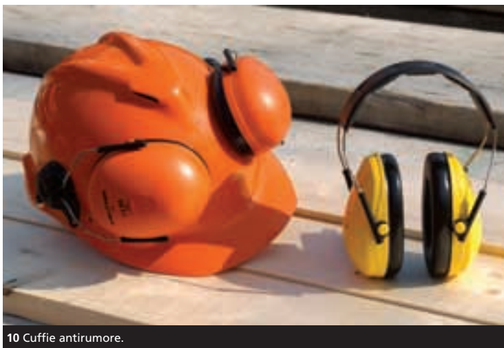
10 Cuffie antirumore.