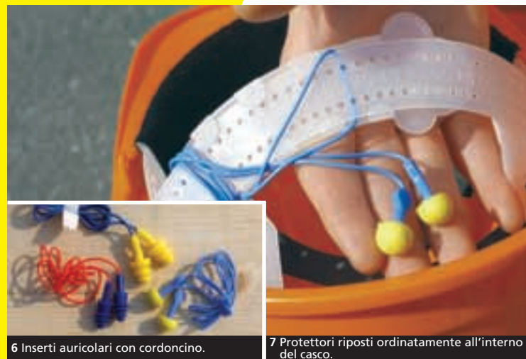
6 Inserti auricolari con cordoncino.