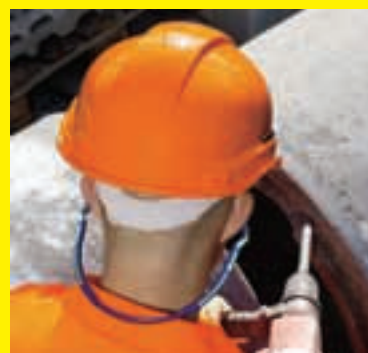
2 Buona attenuazione acustica.

SBV Schweizerischer Baumeisterverband SSE Société Suisse des Entrepreneurs SSIC Società Svizzera degli Impresari-Costruttori Societat Svizra dals Impresaris-Costructurs