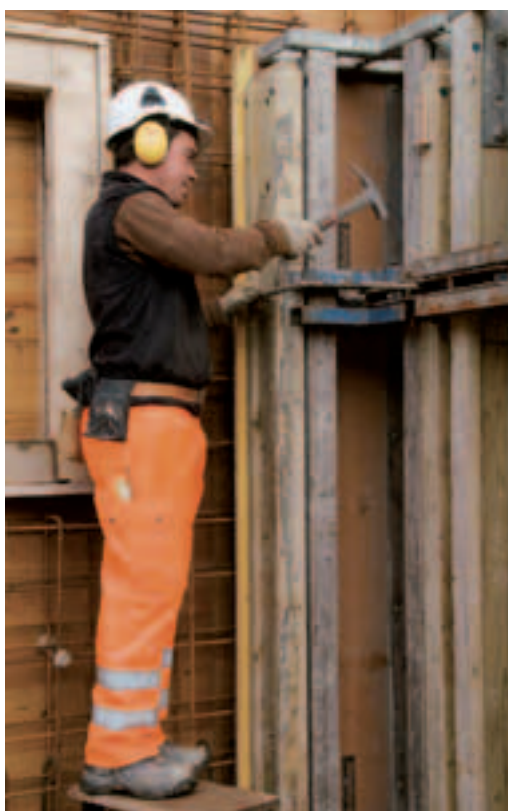
1 Proteggi il tuo udito!

SBV Schweizerischer Baumeisterverband SSE Société Suisse des Entrepreneurs SSIC Società Svizzera degli Impresari-Costruttori Societat Svizra dals Impresaris-Constructurs