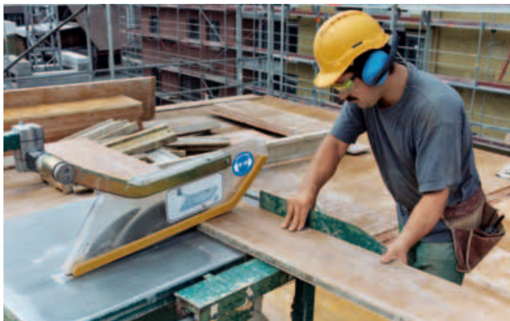
7 Macchine rumorose sono contrassegnate.