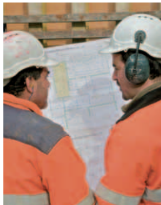
8 Capirsi nonostante la protezione dell'udito.