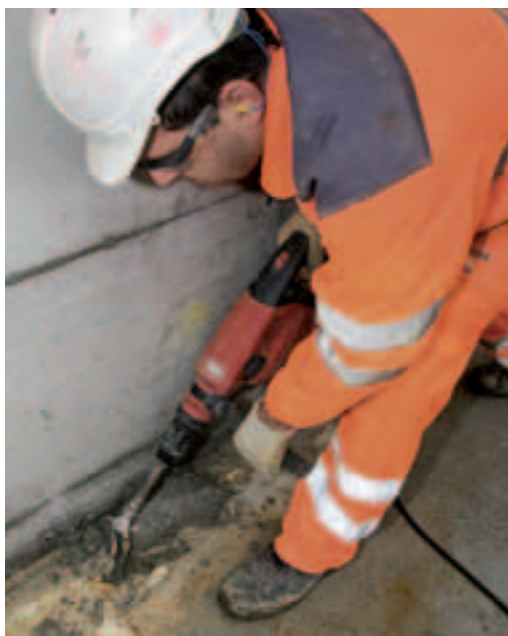
4 Tamponi auricolari comodi in caso di caldo.