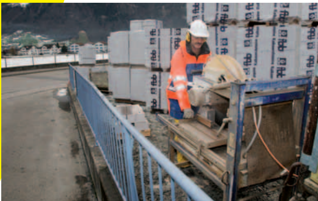
9 Posto di lavoro sicuro per macchinari rumorosi.