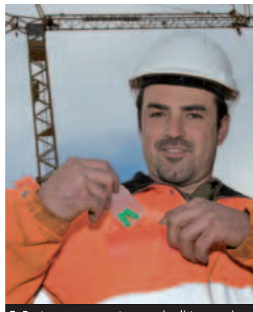
5 Porta sempre con te un paio di tamponi auricolari.