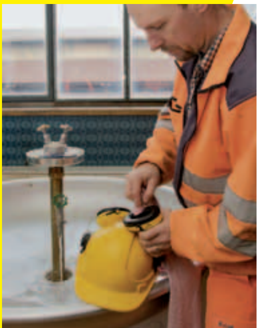
6 Pulizia e manutenzione semplice.