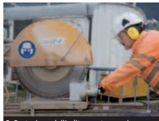
2 Protezione dell'udito con tamponi auricolari o cuffie antirumore.