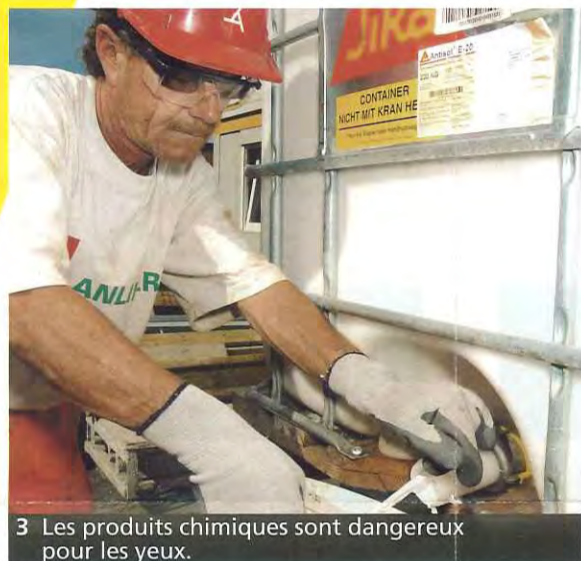
3 Les produits chimiques sont dangereux pour les yeux.