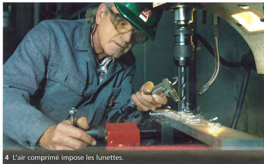
4 L'air comprimé impose les lunettes.