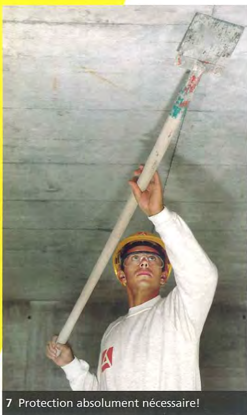
7 Protection absolument nécessaire!