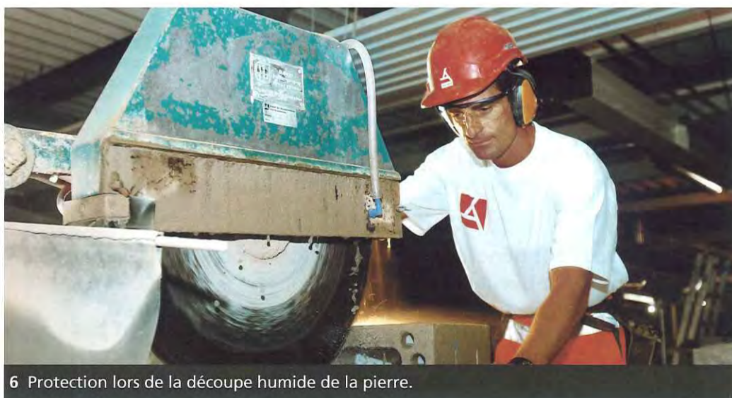
6 Protection lors de la découpe humide de la pierre.