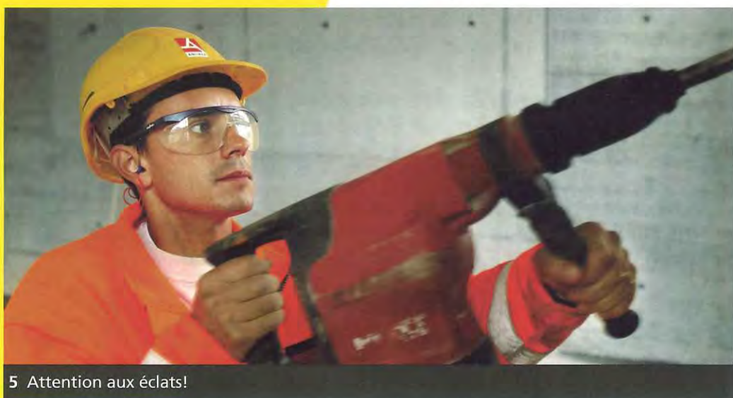
5 Attention aux éclats!