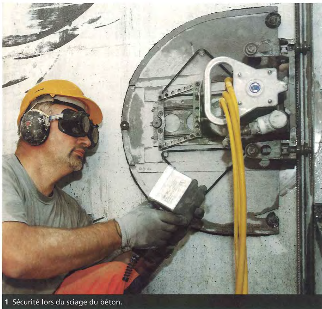
1 Sécurité lors du sciage du béton.

Schweizerischer Baumeisterverband Société Suisse des Entrepreneurs Società Svizzera degli Impresari-Costruttori Societat Svizra dals Impresaris-Constructurs