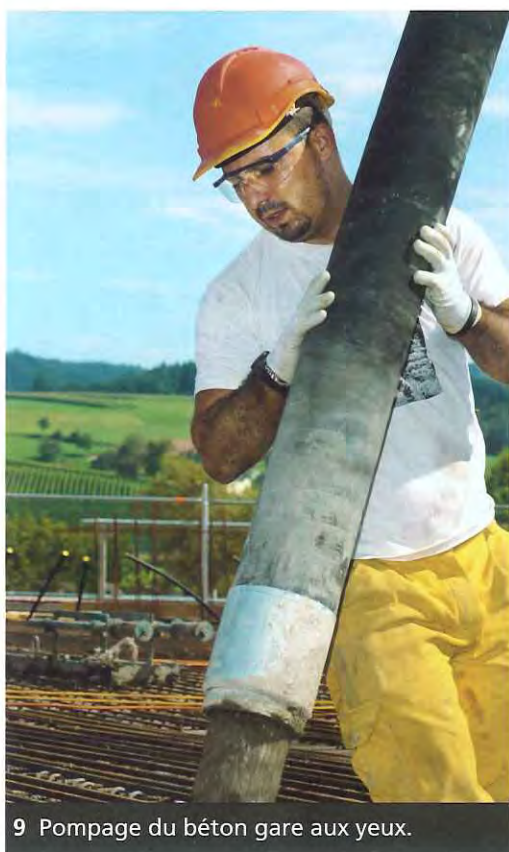
9 Pompage du béton gare aux yeux.