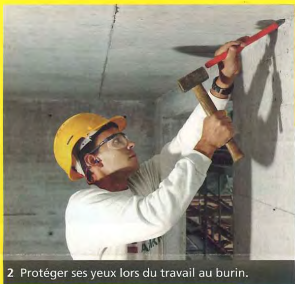
2 Protéger ses yeux lors du travail au burin.