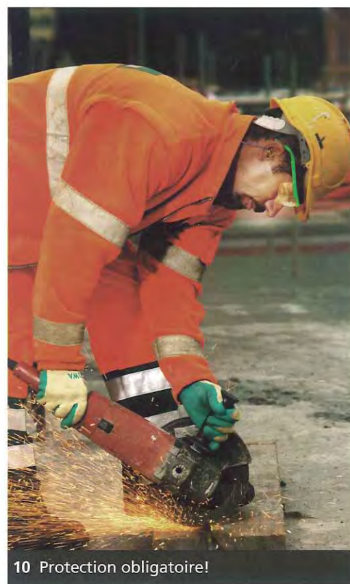
10 Protection obligatoire!