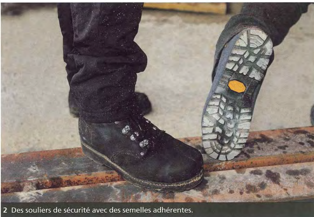
2 Des souliers de sécurité avec des semelles adhérentes.