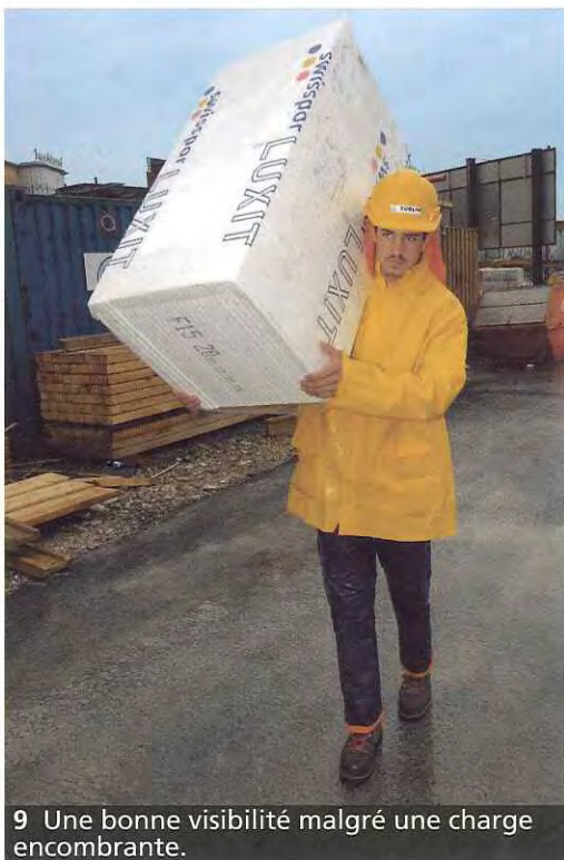
9 Une bonne visibilité malgré une charge encombrante.