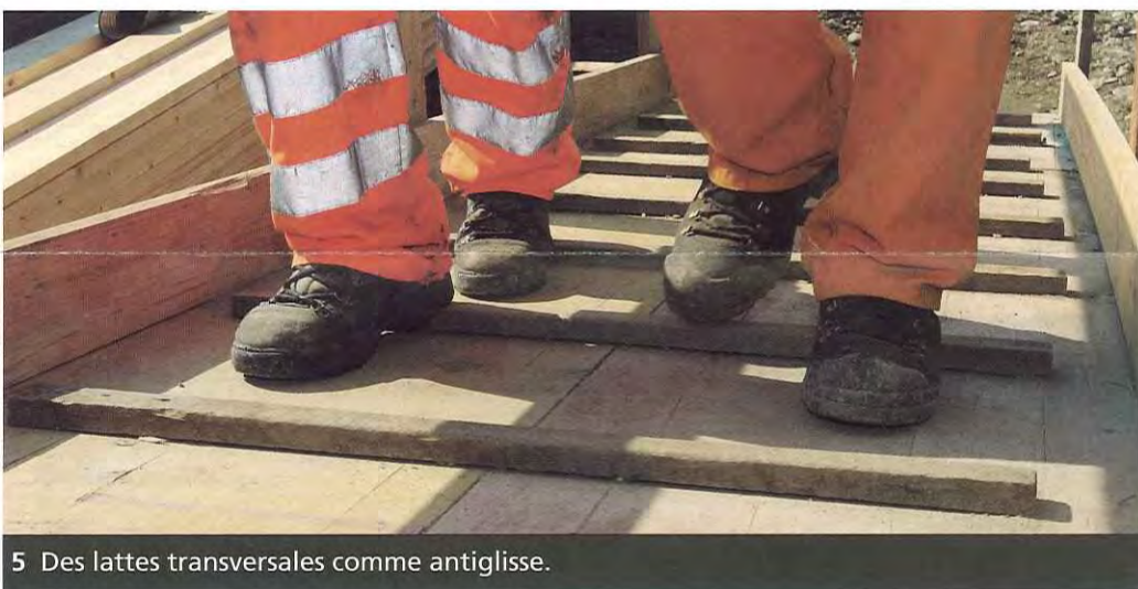
5 Des lattes transversales comme antiglisse.