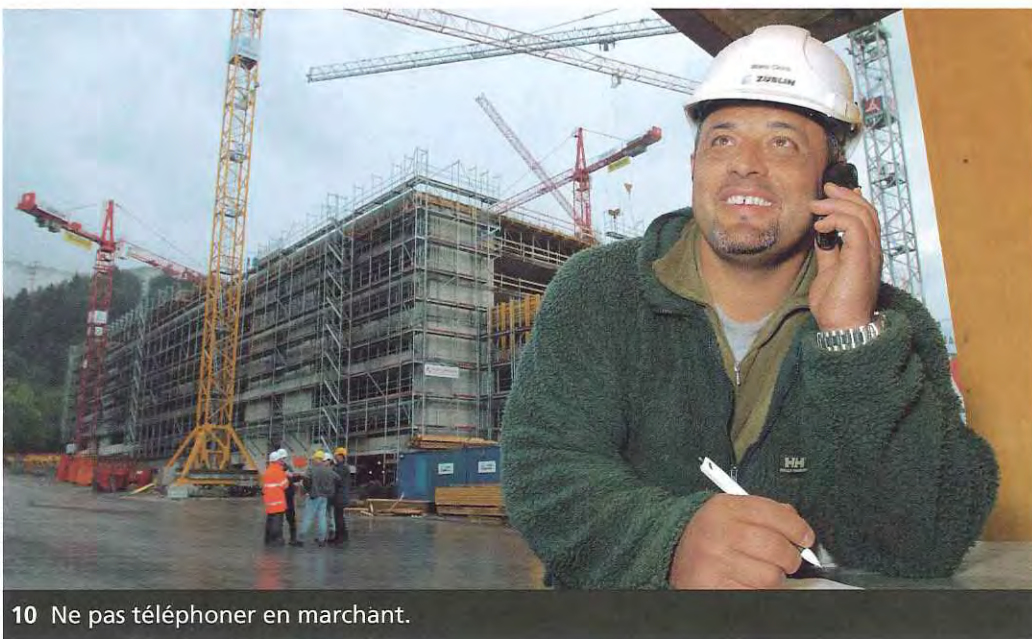
10 Ne pas téléphoner en marchant.