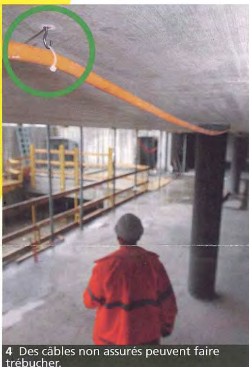
4 Des câbles non assurés peuvent faire trébucher.