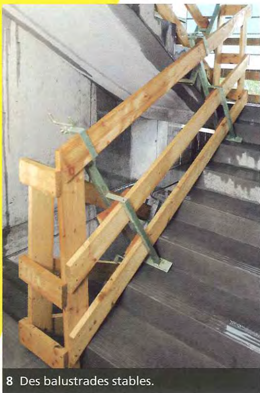
8 Des balustrades stables.