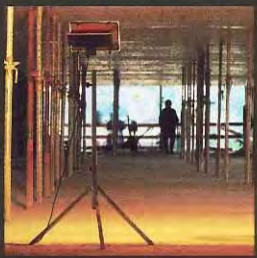
1 De l'éclairage dans les caves et cages d'escaliers.

Français – Ce journal paraît également en allemand, italien, espagnol, portugais et serbo-croate.