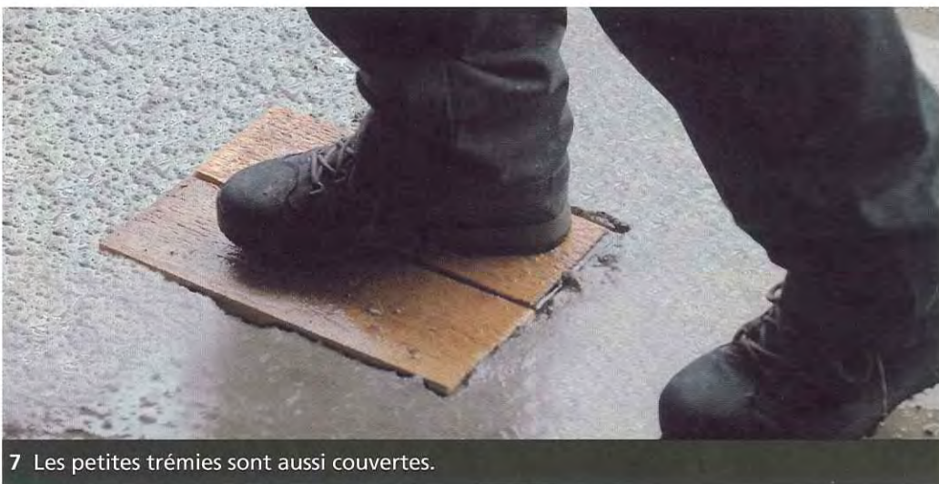
7 Les petites trémies sont aussi couvertes.