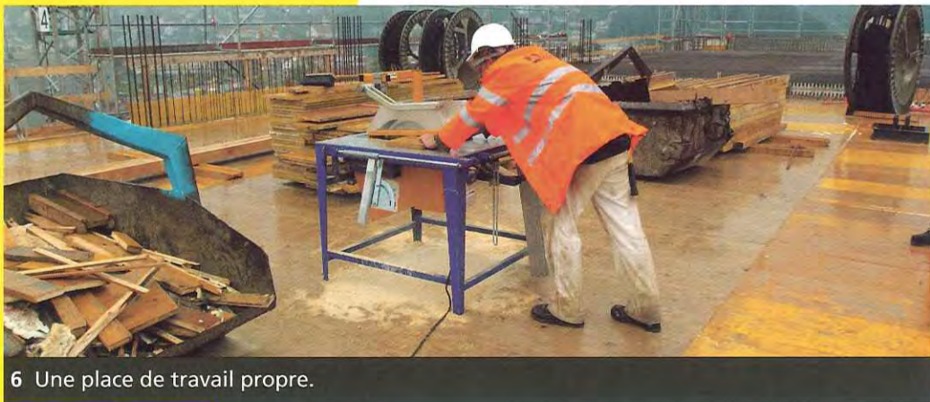
6 Une place de travail propre.