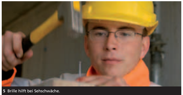
5 Brille hilft bei Sehschwäche.