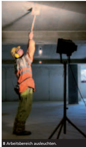
8 Arbeitsbereich ausleuchten.