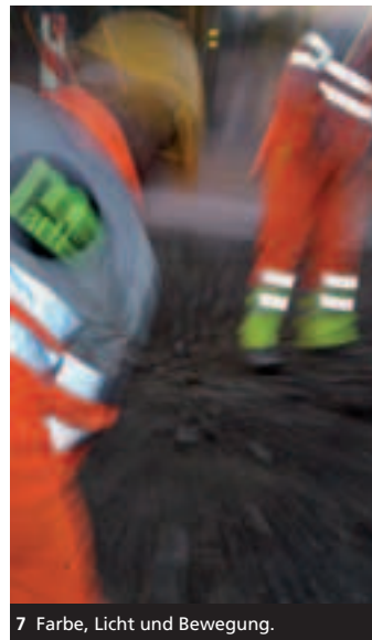
7 Farbe, Licht und Bewegung.