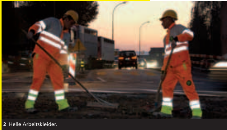
2 Helle Arbeitskleider.