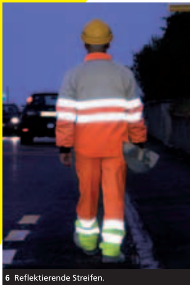
6 Reflektierende Streifen.