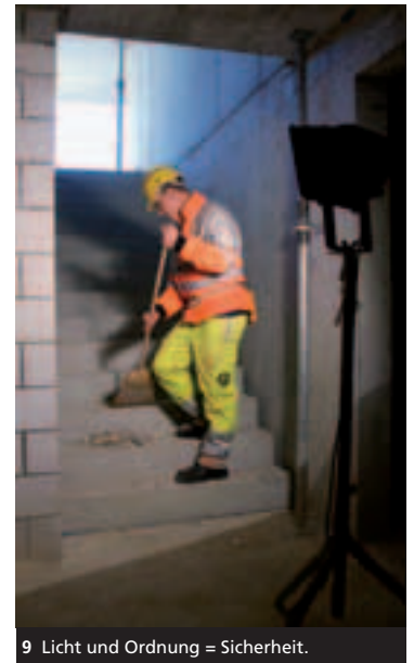
9 Licht und Ordnung = Sicherheit.