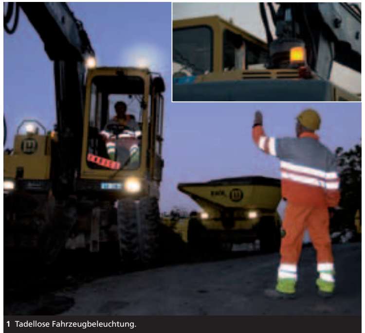
1 Tadellose Fahrzeugbeleuchtung.

SBV Schweizerischer Baumeisterverband SSE Société Suisse des Entrepreneurs SSIC Società Svizzera degli Impresari-Costruttori Societad Svizra dals Impresaris-Constructurs