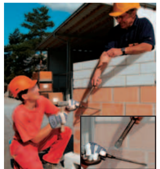
Keine improvisierten Werkzeuge.