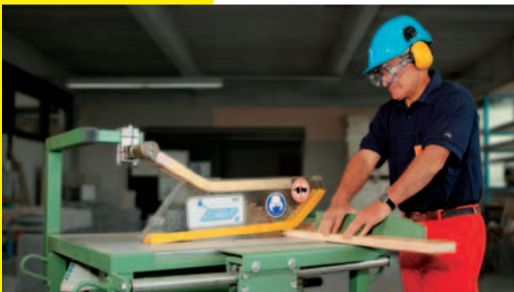
Ist Schutzhaube in Ordnung?