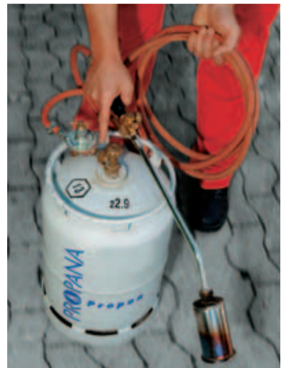
Sind Schläuche und Ventil dicht?