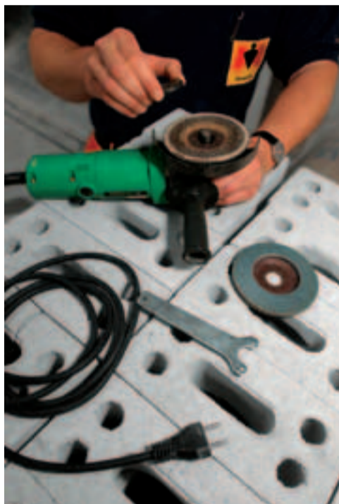
Zuerst Stecker ausziehen!