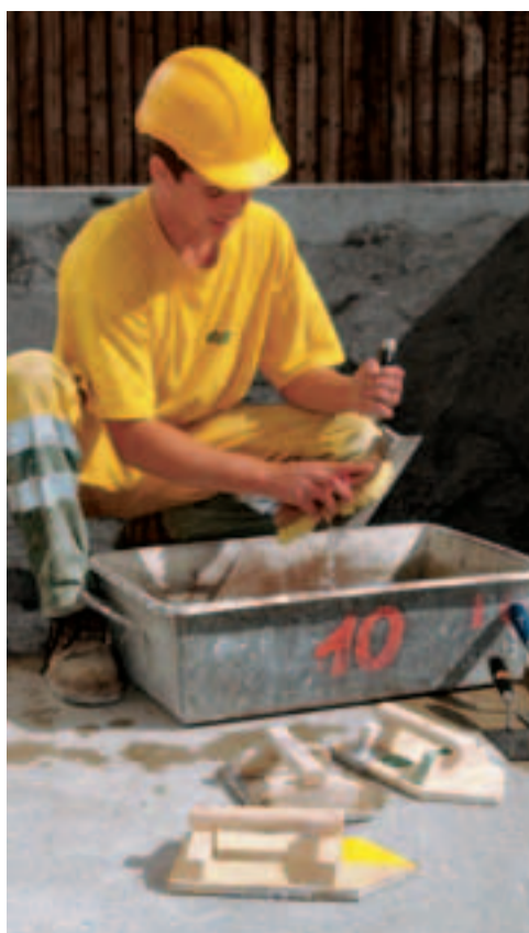
Vor dem Versorgen reinigen.

SBV SSE SSIC Schweizerischer Baumeisterverband Société Suisse des Entrepreneurs Società Svizzera degli Impresari-Costruttori Societad Svizra dals Impresaris-Constructurs