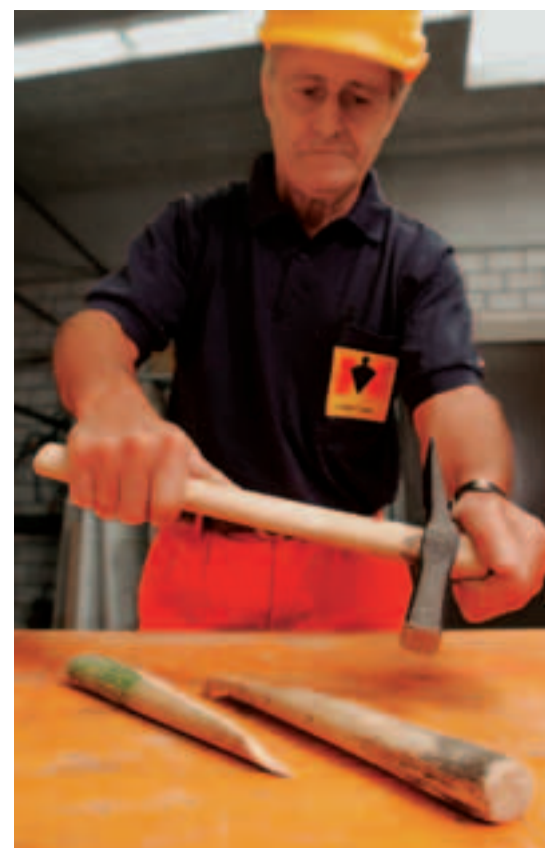
Defekte Werkzeugstiele ersetzen.