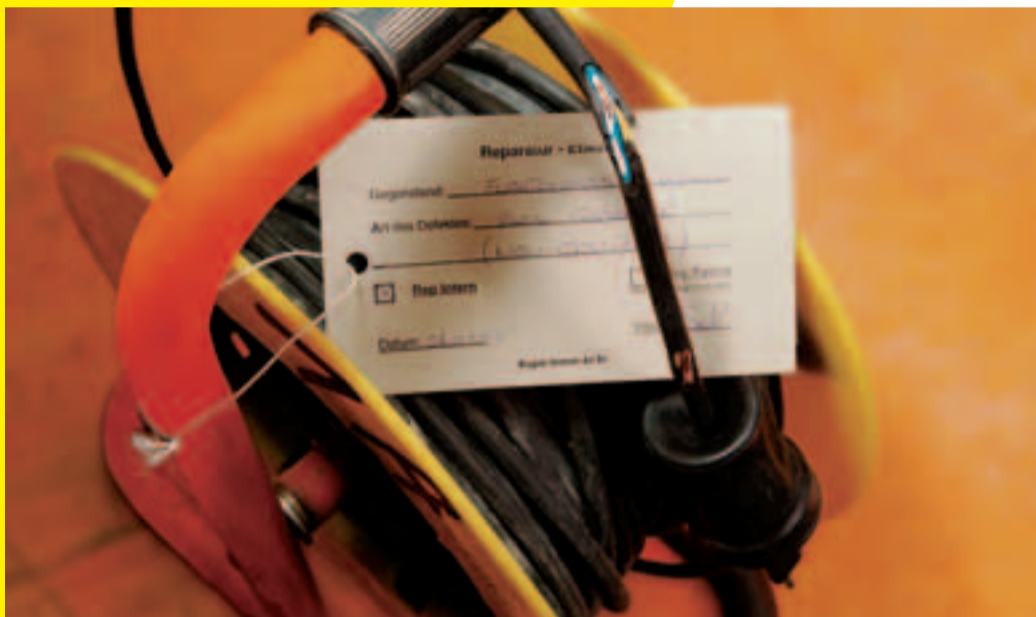
Sofort in Reparatur geben.