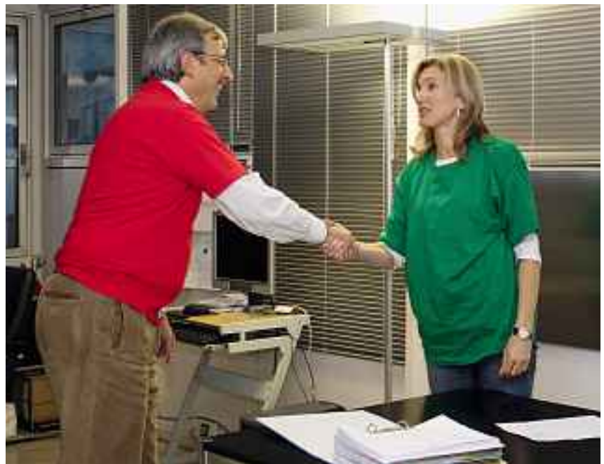
Saluto di benvenuto ad una lavoratrice temporanea nell'impresa utilizzatrice.

Il nuovo passaporto di sicurezza individuale CFSL per i lavoratori temporanei dove vengono registrate le istruzioni e le formazioni sostenute in tema di sicurezza sul lavoro e tutela della salute sul posto di lavoro.